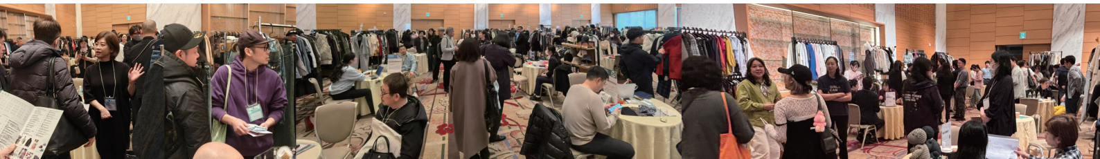
日本成衣智造沙龙展大阪展示会现场图片