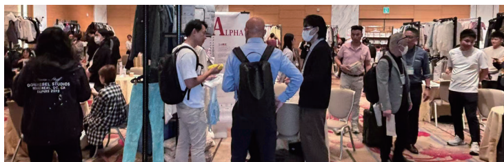
日本成衣智造沙龙展大阪展示会现场图片

大阪展示会承袭沙龙展基本特色, 展会时间选择在采购档期举办、会场选择在市中心交通便利的场馆、现场提供免费饮料等。展会设有“新材料·新技术”、“高级成衣&时尚选品”和“快时尚”三个板块, 分别对应技术领先型、工艺见长型和性价比优势型的企业参展。